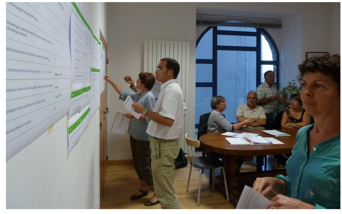
Atelier construction du guide

Le guide ainsi élaboré, est validé par les élus et sert de programmation à la maîtrise d'œuvre. Enfin, une relecture permet les réajustements.