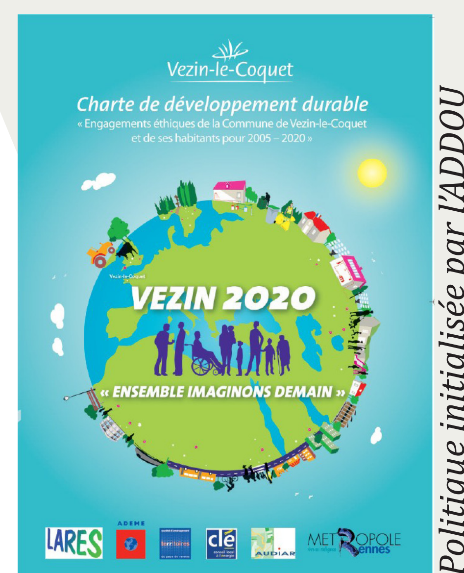
Politique initiée par l'ADDOU